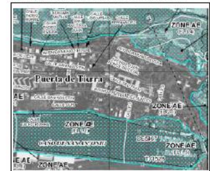
Mapa de Zonificación Hoja Número 80 Vigencia 18 de Julio de 1991