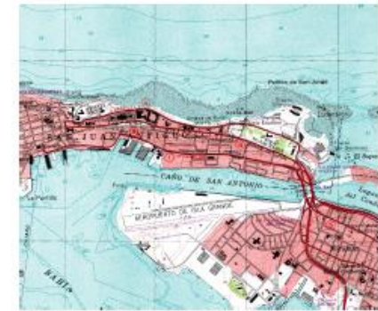
US Geological Survey Map DMA 1323 95-0103 E385 Photoreleased 1982